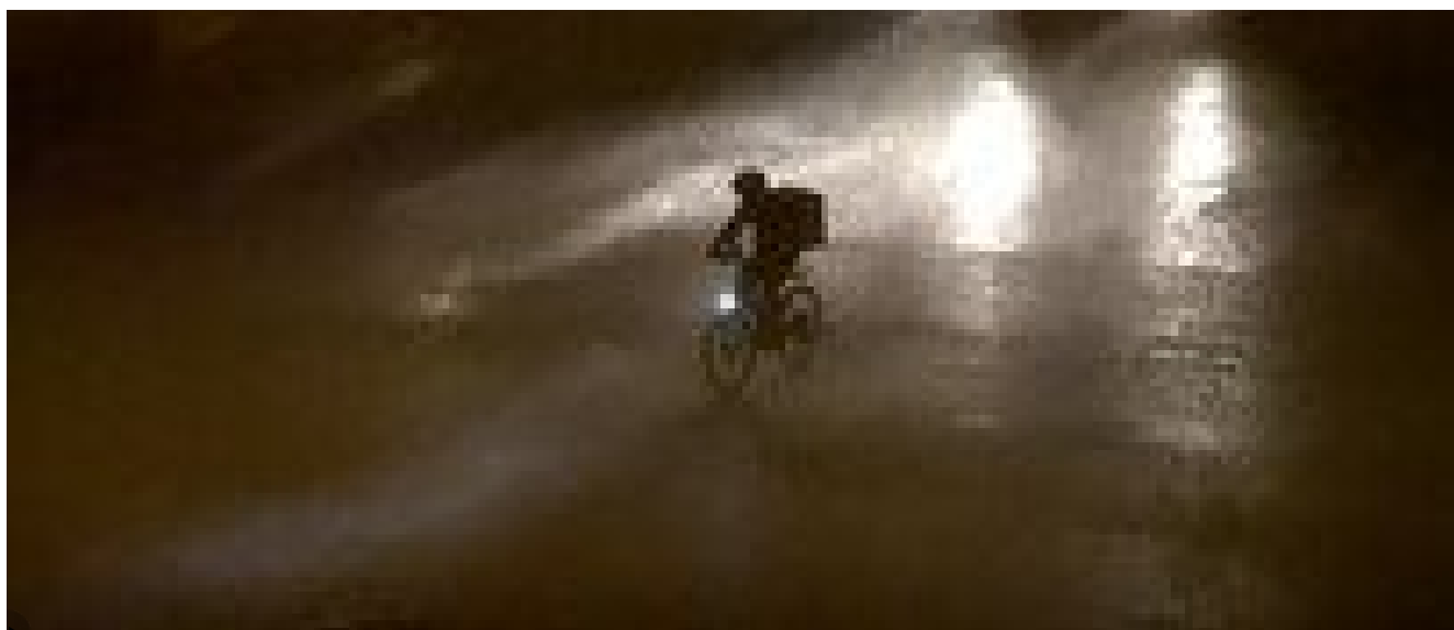
Maltempo: Il racconto del rider nel diluvio, protagonista del video virale