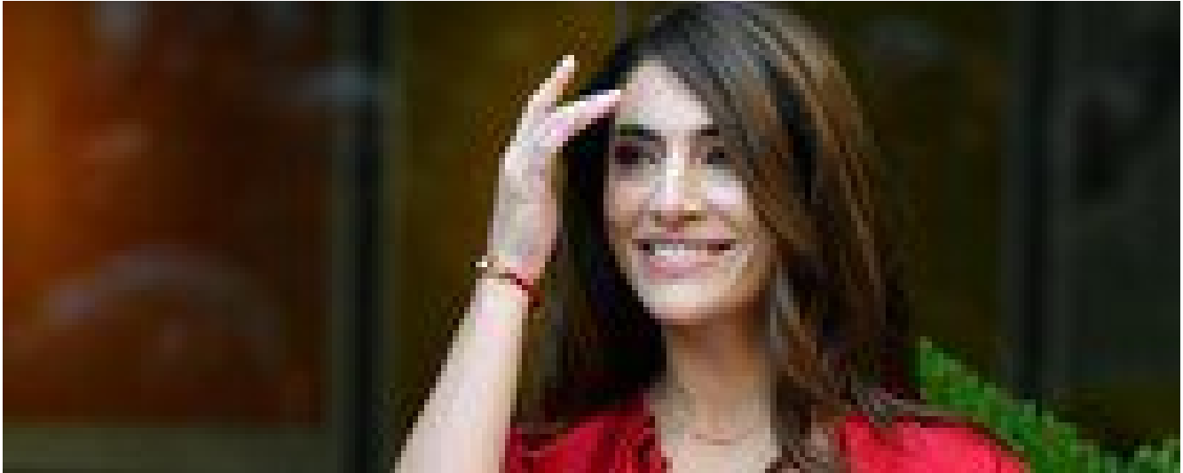
Caterina Murino, madrina a Venezia: 'Non sono più una Bond girl'